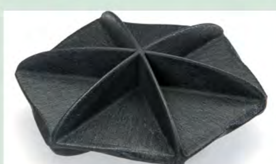
Schwimmkörper (Beschattung und Geruchsminimierung von Gewässern)