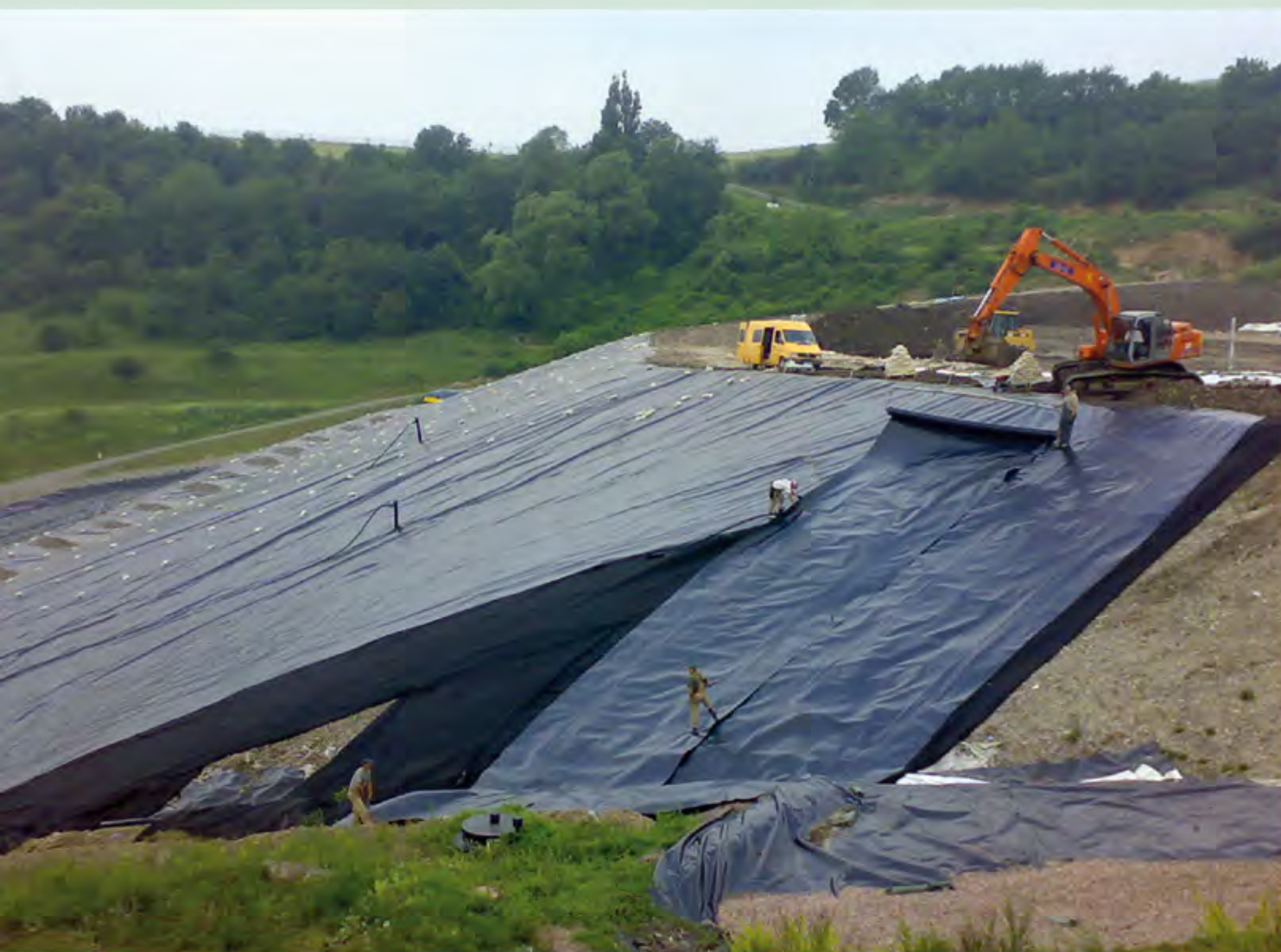
Deponieabdichtung mit KDB

Zusätzlich stellen wir Kunststoffbehälter in der firmeneigenen Werkstatt in Wunschgröße her. Als Ihr Dienstleister mit zertifiziertem Fachpersonal nach DVGW- und DVS-Richtlinien richten wir den Blick stets nach vorne.