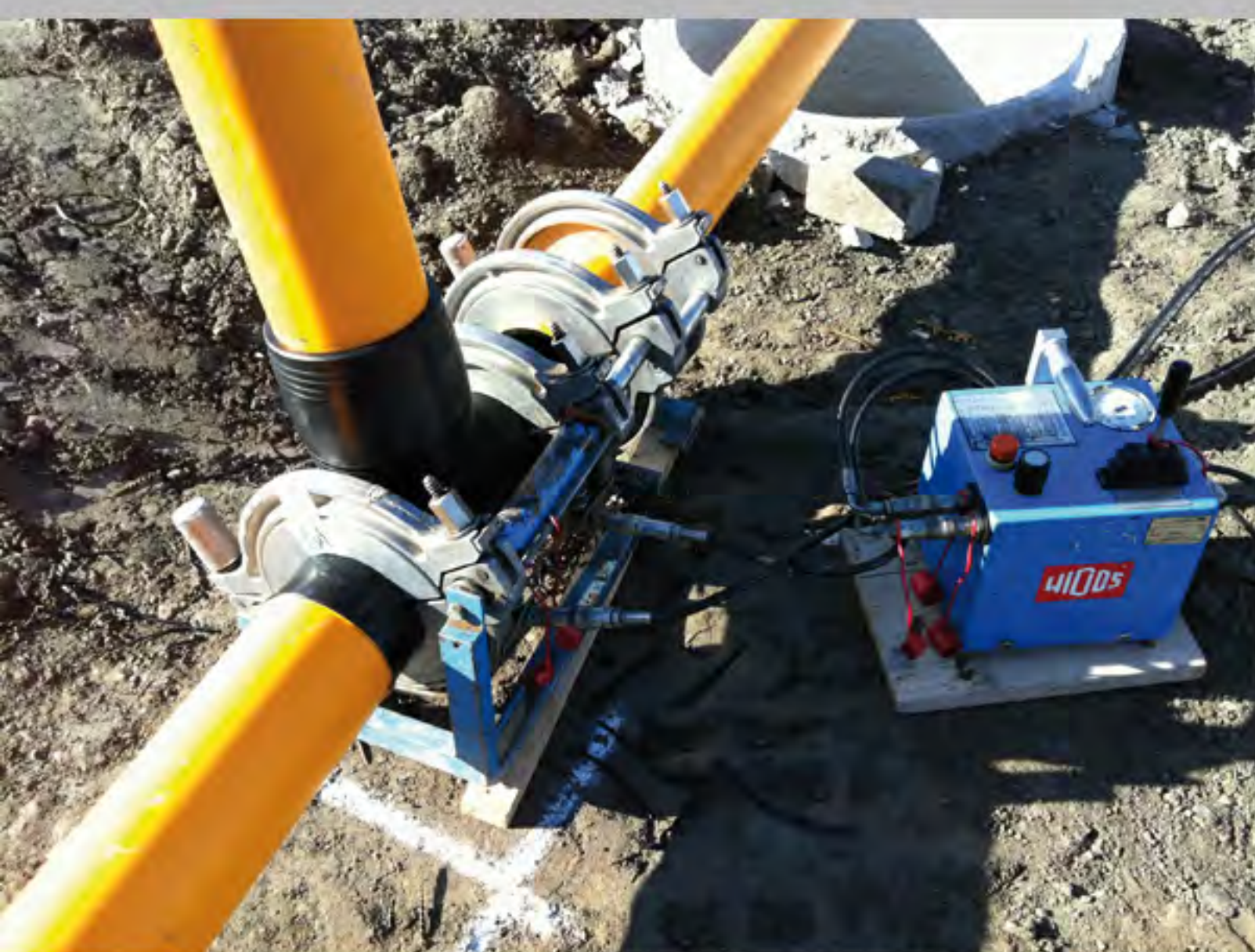
Verschweißung v. Rohrleitungen