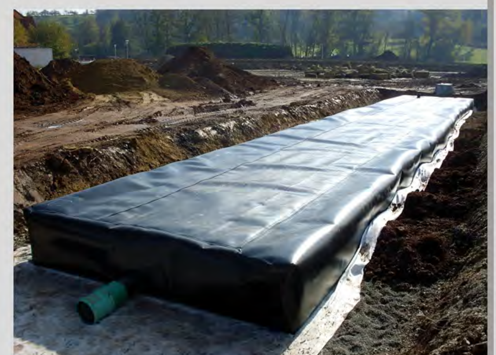
Rigole als Wasserspeicher