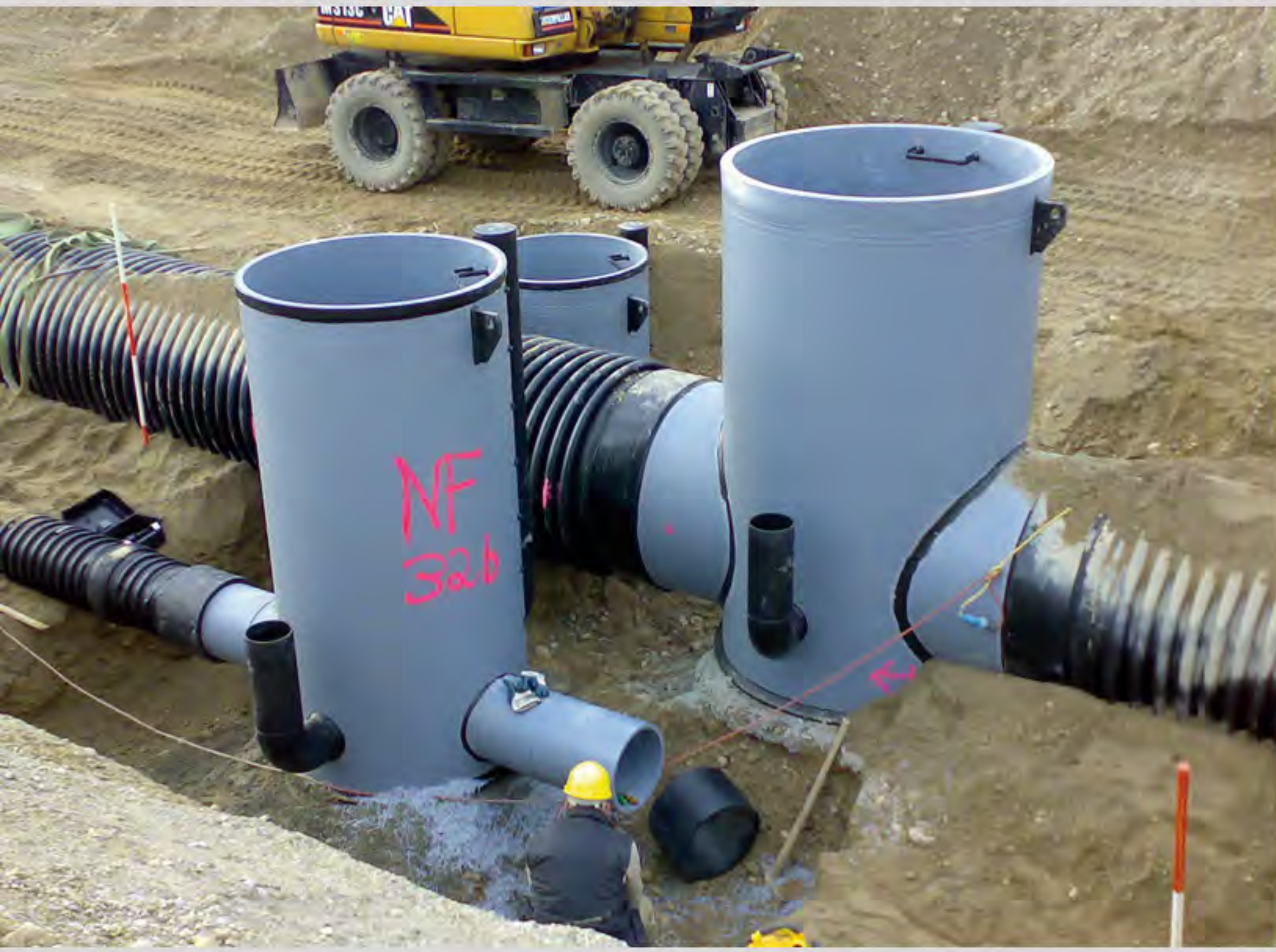
Abwasserschächte im Straßenbau