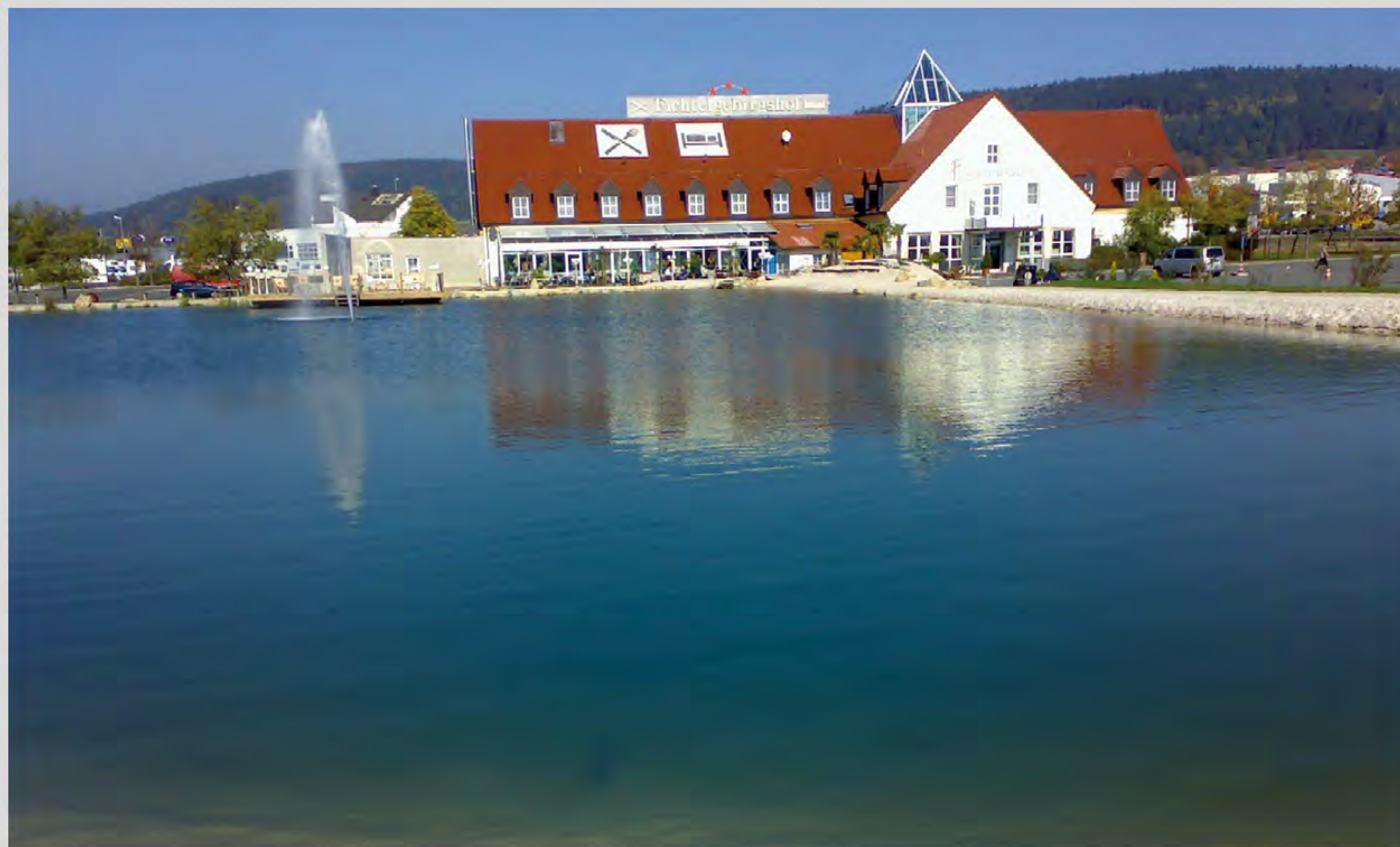
Hotel - Badesee