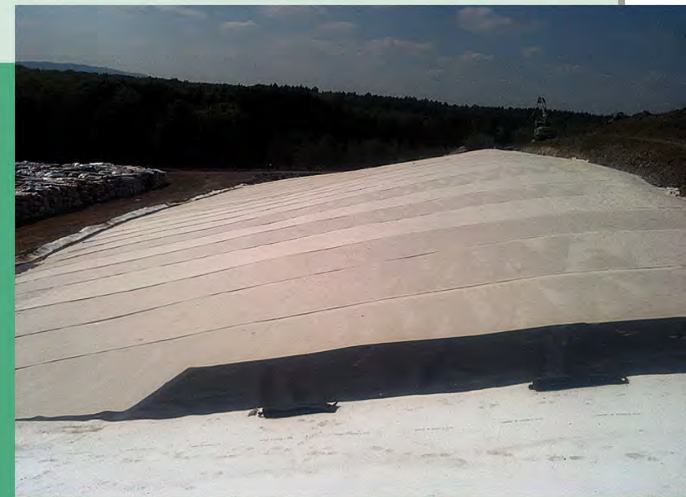
Deponieabdichtung mit KDB und Bentonit